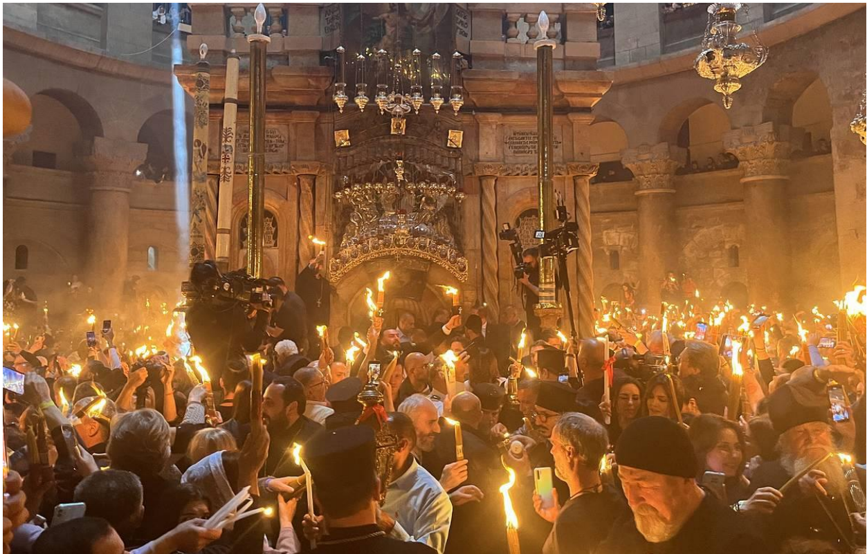
Рисунок 4, 5 – Снисхождение благодатного огня