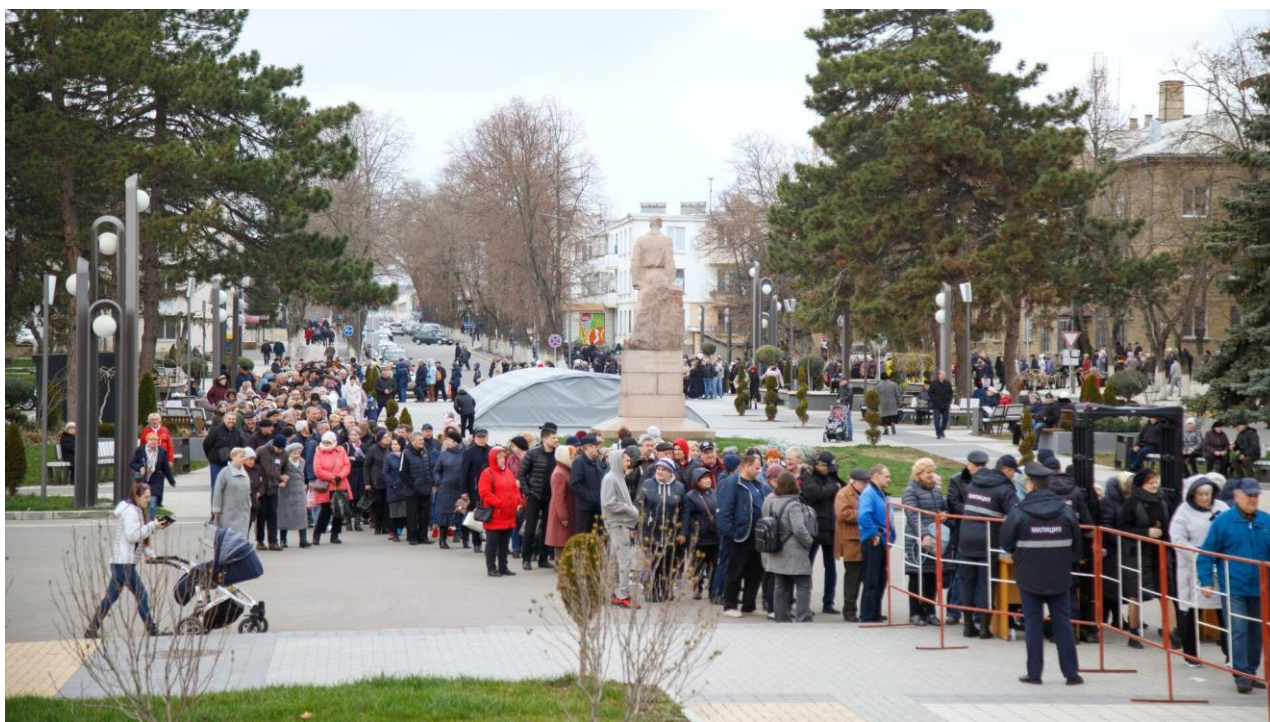
Рисунок 1 – Очереди на выборах президента России 17.03.2024

Играет торжественная музыка, у всех приподнятое настроение, мысли адептов окрылены надеждами на перемены к лучшему. Заходя в сакральное место, свершающие ритуал выстраиваются в очередь, за возможностью свершить ритуал. Участие в ритуале нужно заслужить, пусть и минимальными усилиями. На этом строятся и компьютерные игры. Чтобы получить баллы, нужно приложить усилия, пусть и виртуальные. Обычно эти усилия выражаются в потере времени. В общем, усилия должны быть достаточно большими, чтобы участник ощущал ценность ритуала, при этом достаточно достигаемыми, чтобы участник гарантированно мог их совершить. Итак, адепт проходит в ритуальную кабинку, где он остается один на один с листиком, где начертано имя источника его надежд и чаяний. Он осеняет священное имя крестиком или, на худой конец, галочкой и проносит заветный листик к сакральному коробу, который, несмотря на свою прозрачность, хранит в себе великую тайну.