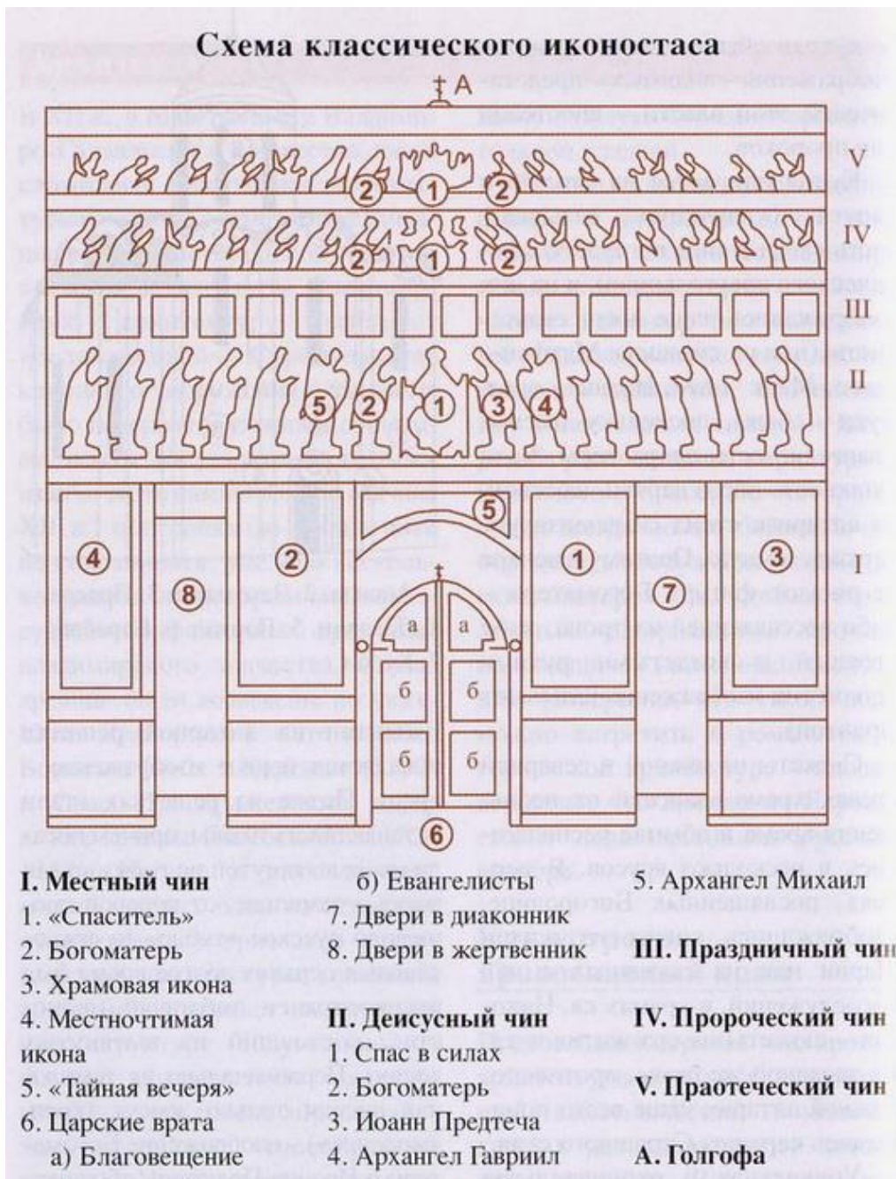
Рисунок 2 – Схема классического иконостаса

На первом плане Сам Он, богоизбранный... ой, простите, народоизбранный. Там же показывают картины со сценами его жития. На них он выступает в роли различных чинов. В одном чине он само воплощение доброты с детьми и ягнятами (целует мальчика в живот). В другом чине строгий, но справедливый карающий судья, такой себе, «Спас в силах», «Пантократор» («Будем мочить в сортире!»).