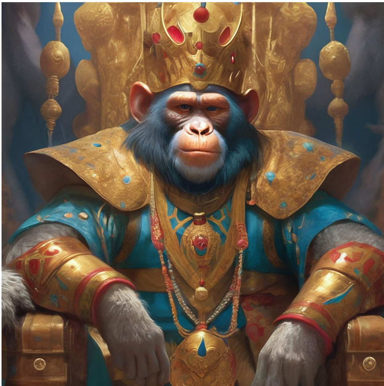
Рисунок 7 – Царь обезьян

Изменения в социально-политическом устройстве всегда берут своё начало от изменения системы верований. Менять её сложно и больно, но если этого не сделать, то всё останется, как есть.