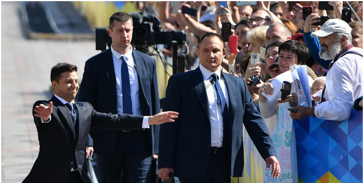
Рисунок 6 – Инаугурация президента Украины В. Зеленского